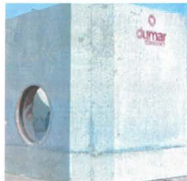
Fig. 2 Bază cămin secțiune rectangulară