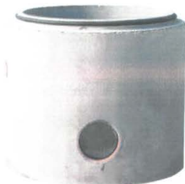
Fig. 1 Bază cămin secțiune circulară